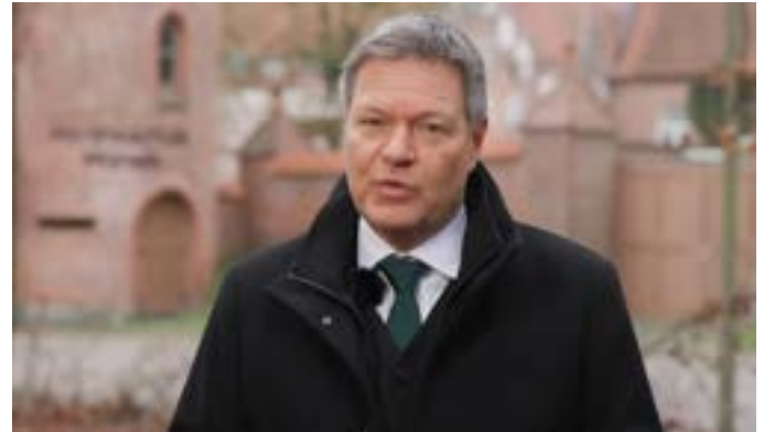
Robert Habeck als Wirtschaftsminister bei seiner Neujahrsansprache 2025 >link

Linke und progressive Wähler sehen in ihm oft denjenigen, der ökologische Modernisierung, soziale Flankierung und liberale Bürger-