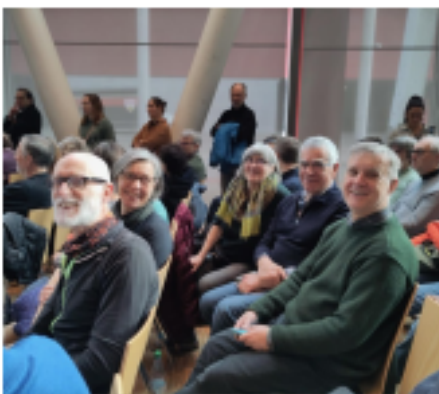
Zum Glück haben wir einen Sitzplatz!