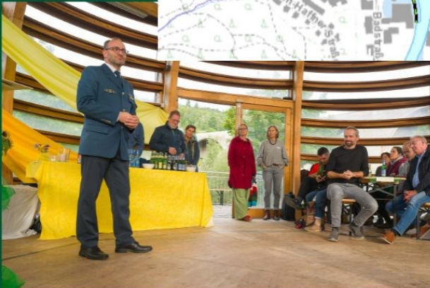
Links: Vortrag des THW zum Thema Katastrophenschutz bei Party und Politik