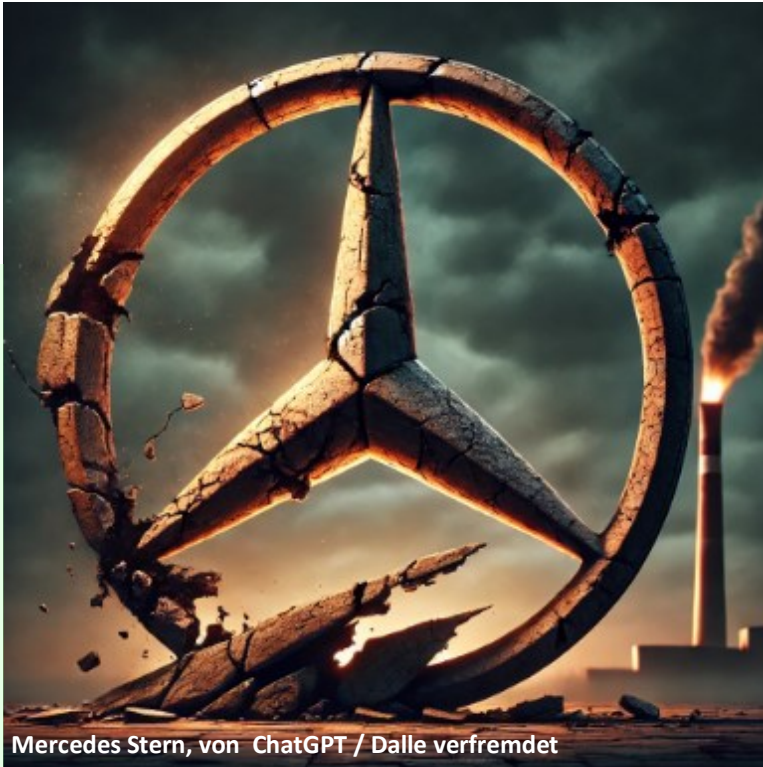
Mercedes Stern, von ChatGPT / Dalle verfremdet

Ein Schwäbisches Sprichwort, das sich zur Zeit leider sehr bewahrheitet. Die nächsten Jahre werden hart, heißt es. Auch für die vielen Zulieferer.