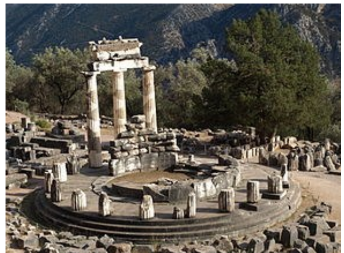
„Erkenne Dich selbst“ und „Nichts im Übermaß“ steht über dem berühmten Orakel von Delphi.

Dass das was mit Politik zu tun haben könnte, erscheint allerdings immer noch ungewöhnlich. Meist gilt halt: „Wie es drin aussieht, geht keinen was an!“