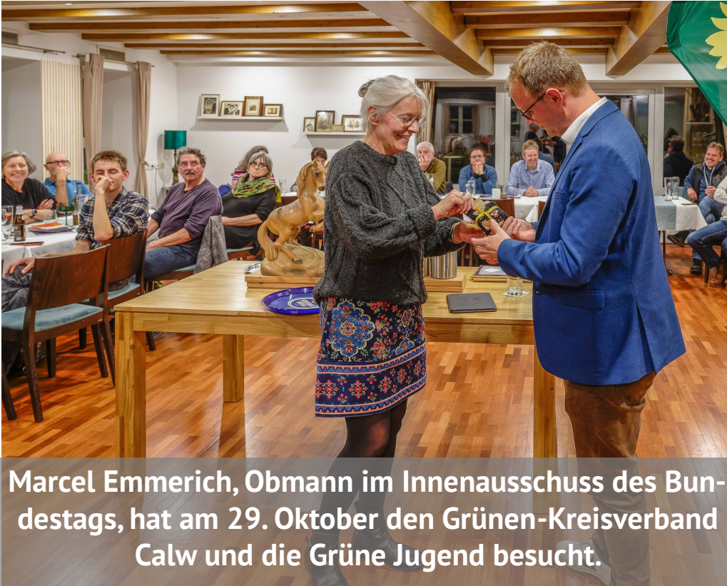
Marcel Emmerich, Obmann im Innenausschuss des Bundestags, hat am 29. Oktober den Grünen-Kreisverband Calw und die Grüne Jugend besucht.

Grüne KreisNachrichten: Kreisvorstand Calw Bündnis 90 / Die Grünen – Ausgabe: Nr. 14/ 24